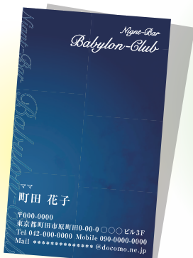
ナイトクラブ・パビロンクラブ 様

コーポレートサイトから携帯サイトまで、多くのホームページ制作実績がございます。また、名刺やパンフレット、チラシなどの印刷物も承っております。