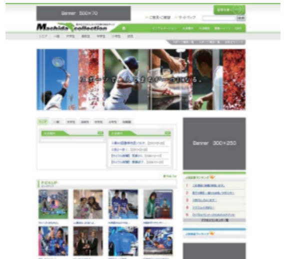
Machida collection 様

ウェブサイト制作 http://www.machida-net.jp/news/