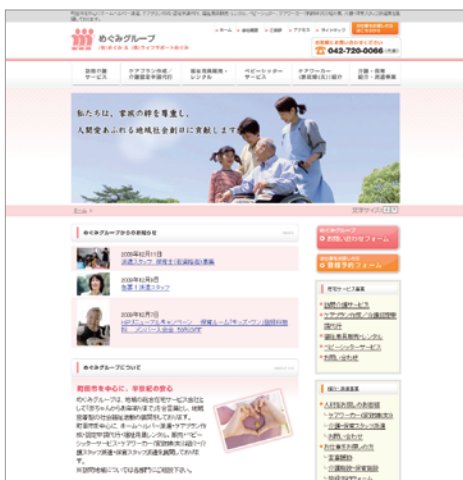
株式会社ライフサポートめぐみ様 ウェブサイトリニューアル http://www.megumi-net.gr.jp/