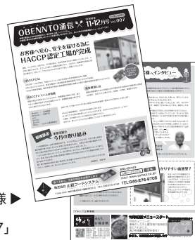
(株)山路フードシステム様 ニュースレター 「OBENNTO通信 Vol.007」

レリッシュのスタッフブログほぼ毎日更新中! http://www.rel-ish.co.jp/staff_blog/