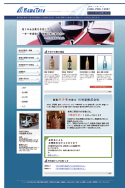
▲川屋株式会社様 ホームページリニューアル