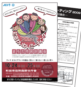
▲社団法人町田青年会議所様 「わいわいミーティング2009」 チラシデザイン