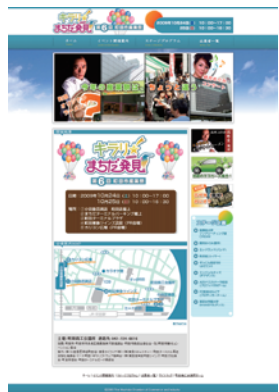
▼町田商工会議所様 第6回産業祭ホームページ制作