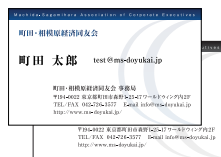
▲町田・相模原経済同友会様 名刺デザイン