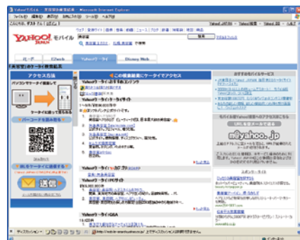
図1 Yahoo!モバイルで「美容院」というキーワードで検索した結果(ケータイの検索結果をパソコンで見ている)

携帯サイトの利用環境の変化から、検索サービスからのアクセスが増えるという現象が起きている。検索サービスが充実する以前は各キャリアのポータルサイトに登録されたサイトの中から見たいサイトを探す方法が多数を占めていました。これにより、携帯サイトでも検索サービスで上位に表示されるための「SEO対策」が必要不可欠となってきています。