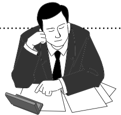
図2 WEBサイト制作の企画段階で使う「プランニングシート」

下図は分譲ワンルームマンションを販売するサイトを構築するケースでのプランニングのサンプル。どんな業種のWEBサイトを構築する際でも初期検討段階で可能な限り細かくターゲット像や最終目標を挙げ、具体的な基本方針を立てる。多くのスタッフが関わるWEBサイト制作だからこそ、コンセプトや基本方針を制作関係者の共通認識とすることが大切。プランニングでの定義がスタッフ全員の認識として浸透しないと、一貫性のあるブレの無いコンテンツ制作は不可能。コンテンツの制作が始まってしまってからプランニングを行うようでは手戻りが多く、制作は非効率になる。